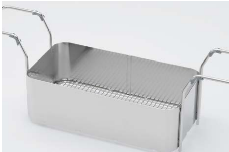
Warenkörbe aus Edelstahl