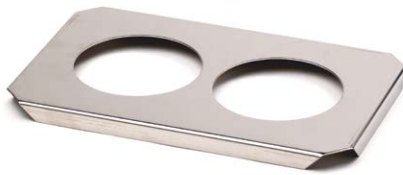
Lochdeckel zum Einsatz von Bechergläsern